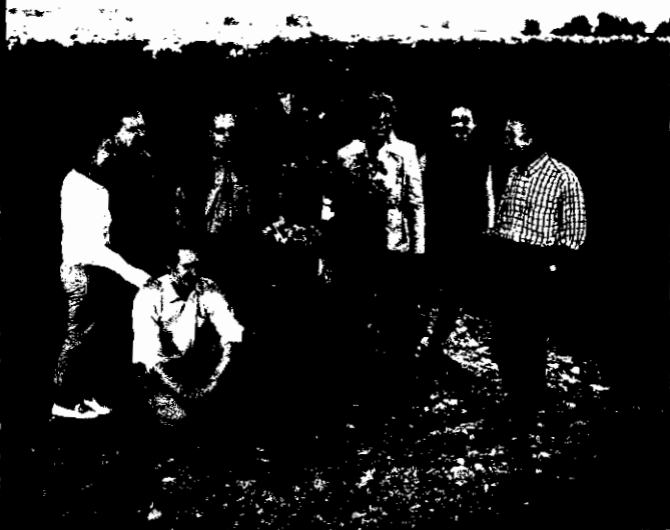
La familia Torres en la viña Mas La Plana